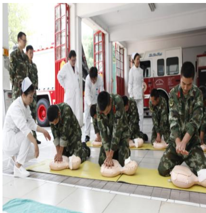
为消防官兵进行急诊急救知识培训和演示

护理、骨质疏松的预防、饮食调理进行讲解，现场进行预防骨折疏松症保健操、颈椎病，腰间盘突出运动保健、手功能康复操的演示指导。母婴护理对孕产妇发放有关母乳喂养好处的宣传资料，正确指导母乳喂养，提供产后保健知识，普及新生儿常见问题的处理等知识。糖尿病护理讲解糖尿病的“五架马车”的护理知识，指导正确使用血糖仪监测及胰岛素注射。肿瘤专科护理对肿瘤病人术后家庭康复、心理指导。血透透析专科针对慢性肾病病人饮食、活动及血透病人的进行了康复指导。康复科护士为基层医院传输康复医学知识和管理经验，开展康复护理教学查房，为失能老人、残障儿童进行体检和指导。