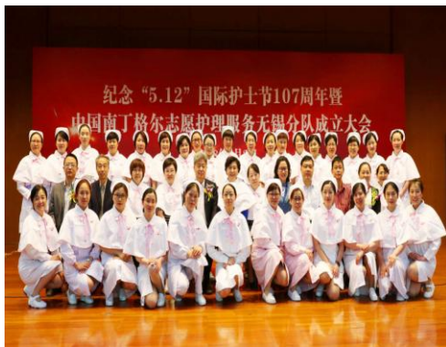
中国南丁格尔护理志愿服务 15 个无锡分队成立

根据学会要求，各医院积极投入，各专业委员会互相协作，全面实施，充分利用医联体平台，为基层临床护理人员送知识、送专业技能，根据需求，将护理专科化发展的内容、新理念、新技能传授给基层护士，发挥省、市级专科护士作用。同时，根据专科特点开展专科护理下基层，走进社区、走进患者家庭、走进养老机构开展健康科普、CPR 现场急救演示、手卫生演示、专科护理等活动，创新性地开展科普讲座、现场咨询和护理服务等活动。