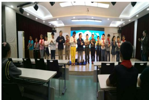
小学生手卫生培训