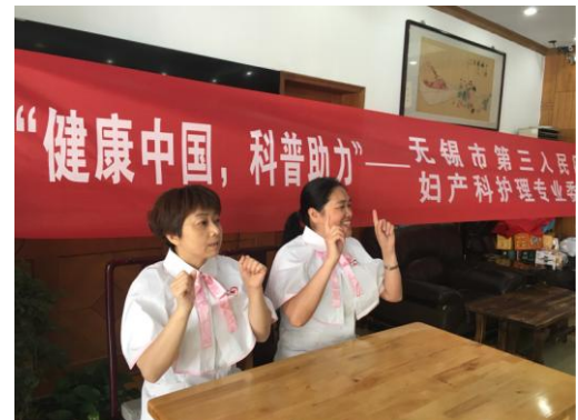
南丁格尔护理志愿服务