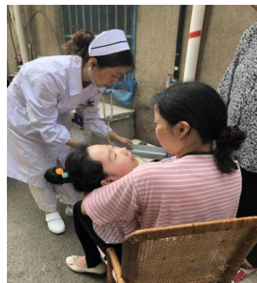
为智障患儿体检和指导